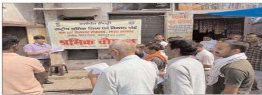
(अमर भारती ब्यूरो)

मल्लावा, हरदोई। कस्बा मल्लावा के बड़े चौराहे पर श्रमिक जागरूकता ही श्रम है अप्रत्याशित रूप से होने वाली किसी भी घटना से बचाती है या उसके जीवन में आगे बढ़ने में सहयोग करती है।