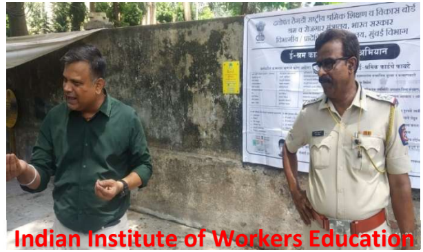
Indian Institute of Workers Education